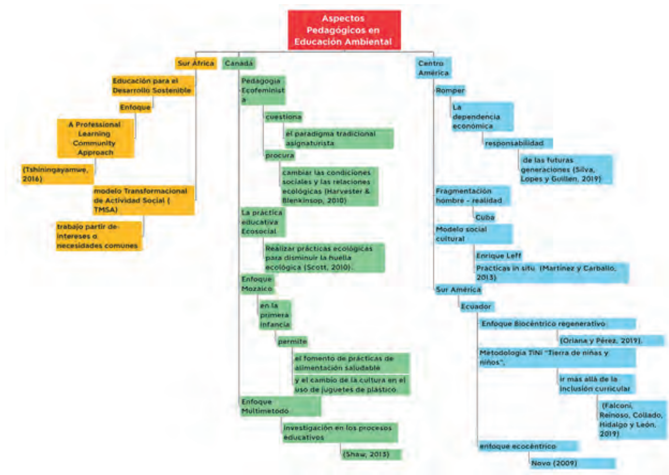
Fig. 2. Enfoques Pedagógicos en Educación Ambiental