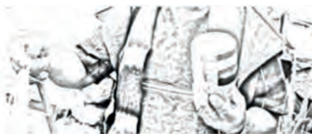
Imagen 1. Tsarap Lulepik o Zarambico.

Para poder jugar este juego, se necesita un zarambico o trompo adaptado, un palo de madera pequeño al que se le clava una guasca y varias cabuyas. El zarambico y la guasca deben ser elaboradas de madera de cerote de páramo o de encenillo.