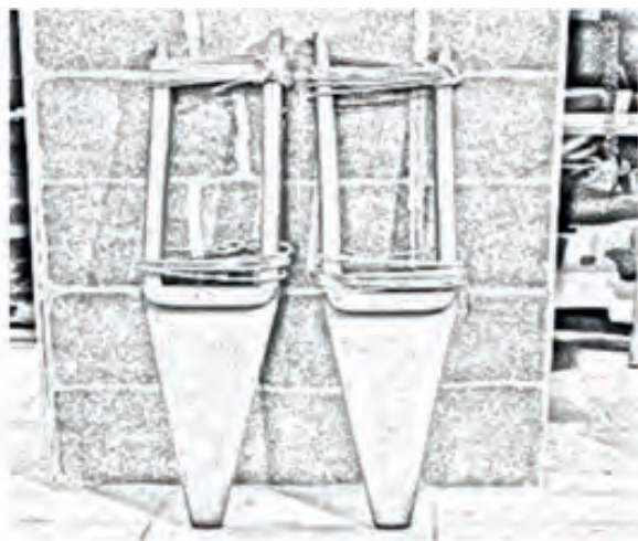
Imagen 3. Tsik Pala Nepuna Ampik o Zancos

Para poder jugar este juego se necesitan los Zancos hechos de palos de madera y cabuya, sobre ellos debe subirse la persona para lograr desplazarse.