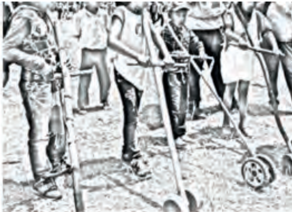
Imagen 2. Chanchiku o Carreto

Para poder jugar este juego se necesita madera de motilón o de cerote del páramo y dos ruedas. Al palo de madera se le atraviesa un palo de madera en el tercio superior, en la parte inferior se le atraviesa uno más pequeño en el cual van las dos ruedas.