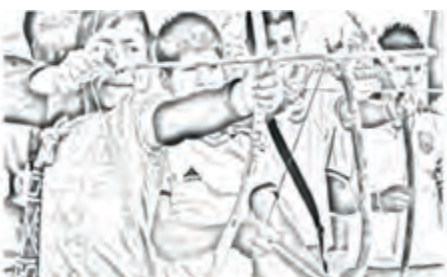
Imagen 4. Lasrúarúk o Arco y flecha

Para poder jugar este juego se necesita arco, flechas y tablero.