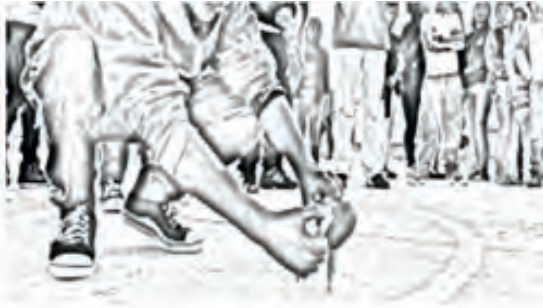
Imagen 5. Dchama o Zumbambico

Para poder jugar este juego se necesita madera y cabuya.