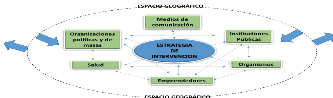
Figura 1: Adecuación de estrategia incrementando acciones en función de la situación epidemiológica existente en el municipio.