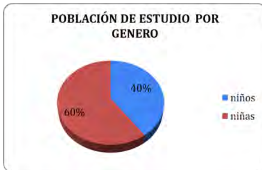
Gráfico: 1. Población de estudio por género.

La gráfica 1 muestra el número de niños y niñas que fueron centro de esta investigación.