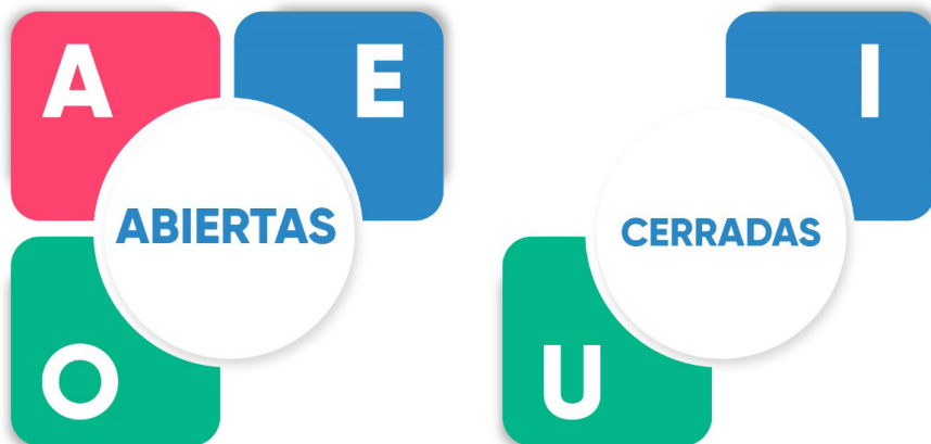
Figura 7. Vocales abiertas y cerradas