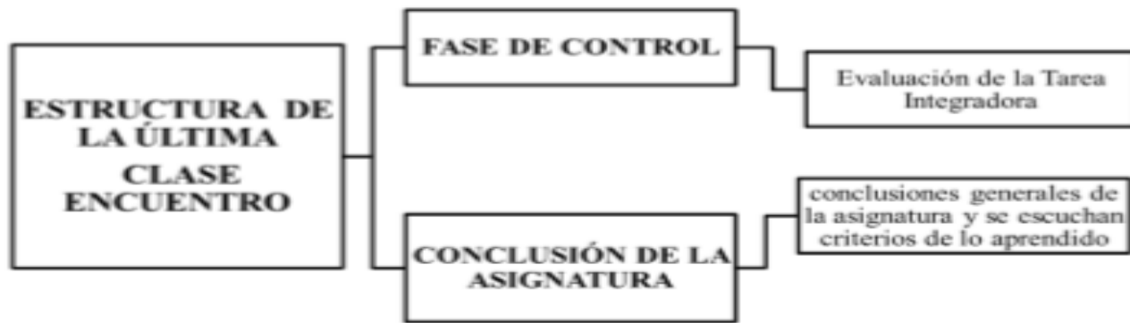
Figura 3 Estructura didáctica de la última clase Encuentro

En estos se pueden aplicar técnicas participativas tanto de presentación como de fin de una actividad.