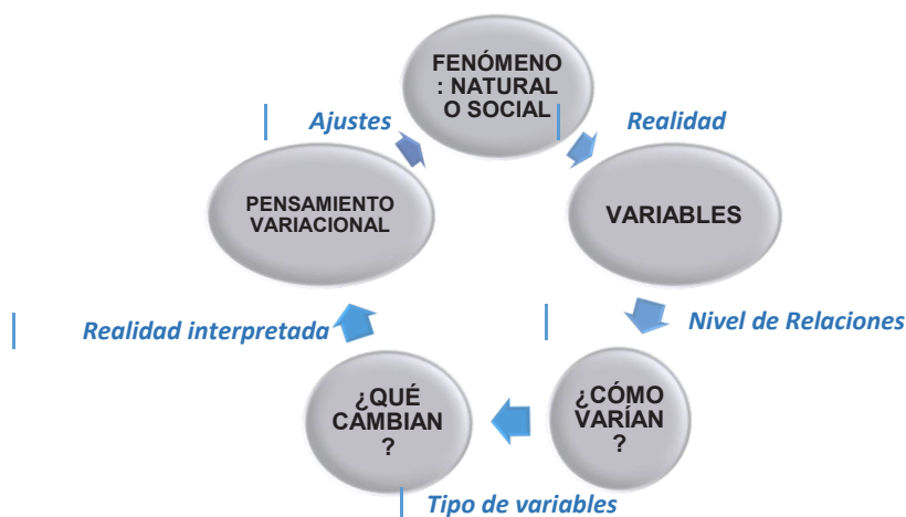
Gráfica 1.