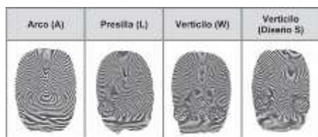
Figura 1. Diseños digitales. (Gastélum, Guedea, 2017)