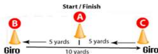
Figura 1. Test de agilidad 5-10-5 propuesto por (Harman y Garhammer, 2008).