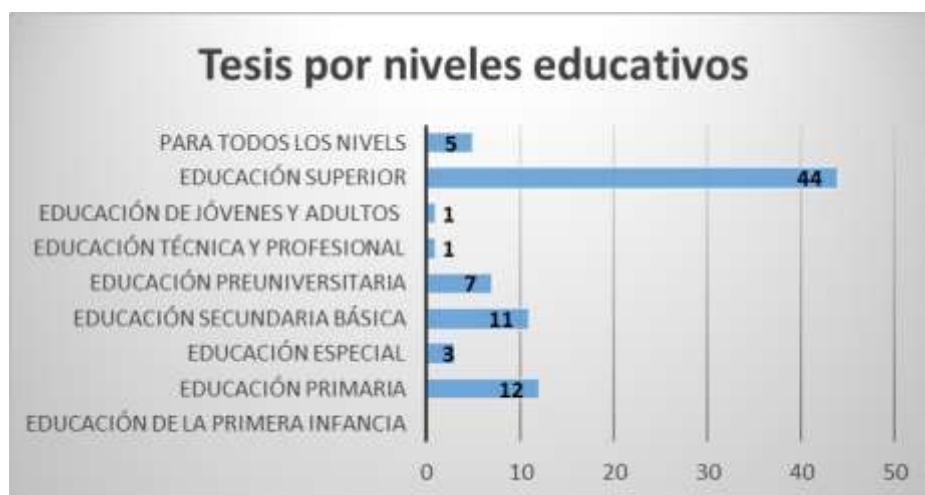
Gráfica 1, Fuente: Elaboración personal.2021

En la gráfica 1 se puede apreciar por nivel educativo la cantidad de tesis defendidas.