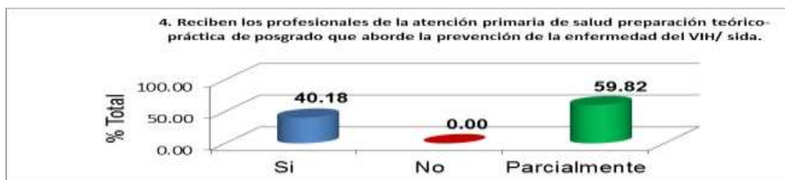
Figura Nro. 3. Preparación teórico –práctica de posgrado de los profesionales de la APS

Por otra parte, el 59,82% refiere que los médicos y enfermeros reciben parcialmente, la preparación de posgrado o curricular para que sean ellos quienes hagan la prevención y control del VIH/sida. Los que responden a que si lo reciben representan el 40,18% y especifican que el conocimiento está en relación con el conocimiento de los factores de riesgo.