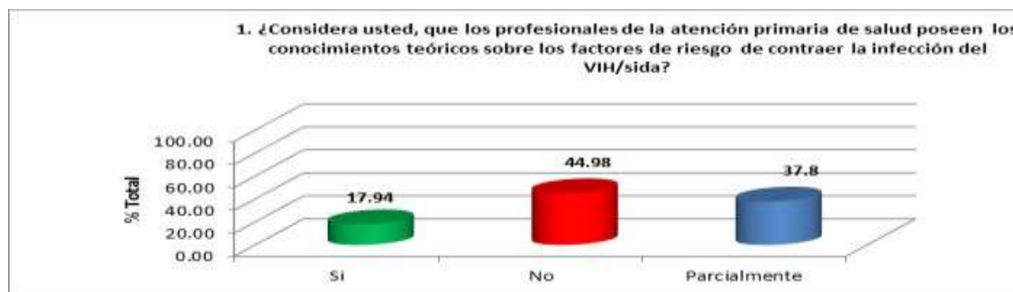
Figura Nro. 1. Conocimientos teóricos sobre los factores de riesgo de contraer el VIH/sida

Tal y como se aprecia en la Figura 1, solo el 17,94 % consideran que los profesionales de la atención primaria de salud poseen los conocimientos teóricos sobre los factores de riesgo de contraer la infección del VIH/sida.