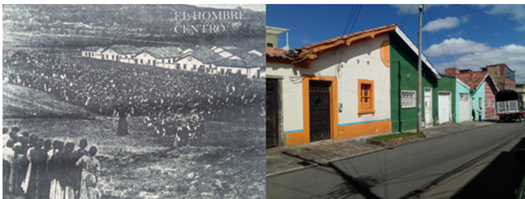
Foto en forma de espejo del barrio Villa Javier.