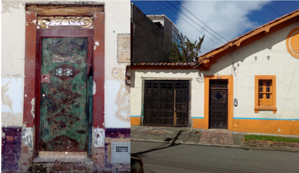
Figura 5. Detalles conservados de las fachadas.