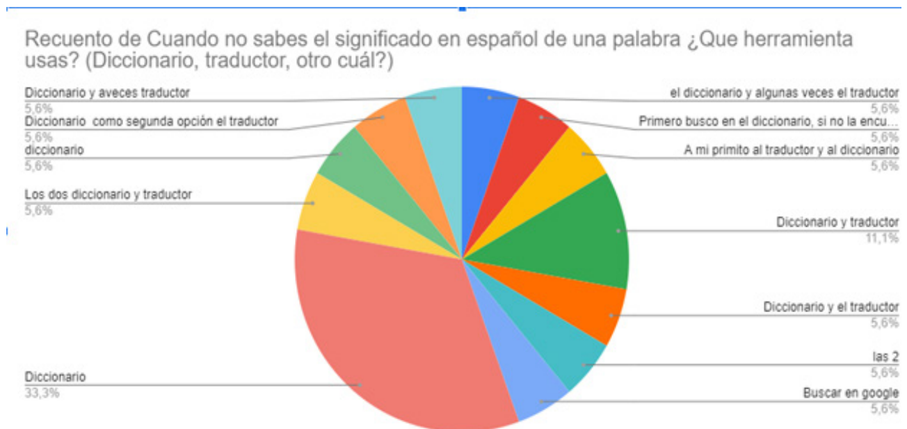
Tabla 1. Resolución de tasks de escritura

En el siguiente diagrama se observa las respuestas proporcionadas por los estudiantes sobre cómo completan tasks de escritura.