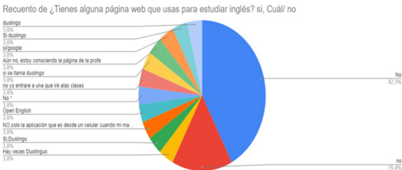
Tabla 2. Uso de las TIC en el aprendizaje del inglés