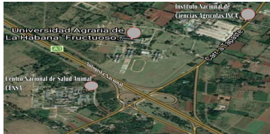
Fuente. Elaboración propia, a partir del satélite

Se pospone hacia el largo plazo el ICA, para con ello asumir los derroteros encontrados en función de la buena práctica que tenga los primeros plazos. En este sentido, se aprovecha la oportunidad de que en la propia UNAH esté emplazado el Centro de Mecanización Agropecuaria (CEMA) como entidades de Ciencia, Tecnología e Innovación, del segundo polo científico del país.