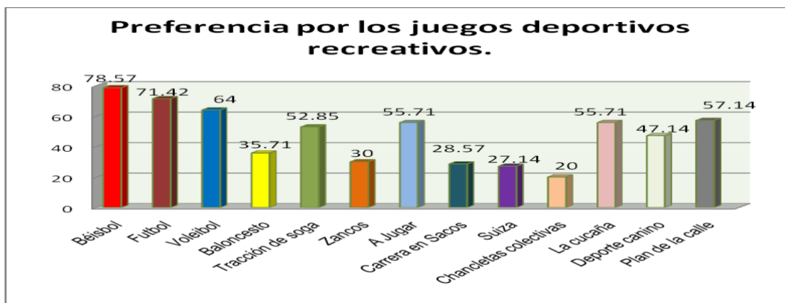
Resultados de gustos y preferencias (gráfico 1)