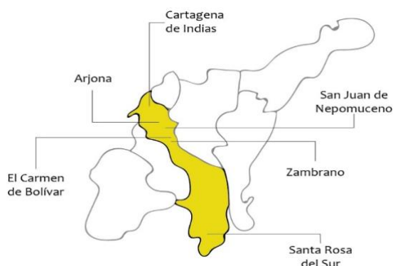
Figura 2 Carmen de Bolívar

de las vías que la comunican, siendo también una problemática la falta de servicios públicos esenciales como energía eléctrica, acueducto y alcantarillado. Es una zona altamente productiva en cultivos de aguacate, ñame espino y maíz, con semillas nativas y mejoradas, siendo la actividad agrícola la mayor fuente de ingresos de las familias.