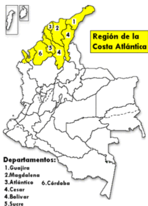
Figura 1. Mapa Costa Atlántica Colombia