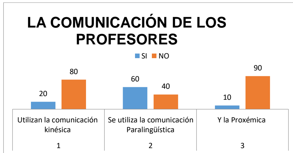
Gráfico 2. Representación de la entrevista a los profesores (después)

El gráfico 2, muestra el 80% de los profesores no utilizan la comunicación kinésica, mientras que solo el 20% la utiliza, (2) profesores. En cuanto a la comunicación Paralingüística el 60 % de los profesores la utilizan con acierto en las clases aspecto que llama la atención por la respuesta a las voces de ordena y manda del profesor.