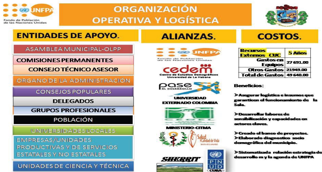
Grafica 1. Proyecto local “Sala para la Gestión del Conocimiento en Dinámica de la Población, Salud y Calidad de Vida”. Datos sobre Entidades de Apoyo y Alianzas. Cuba. 2019