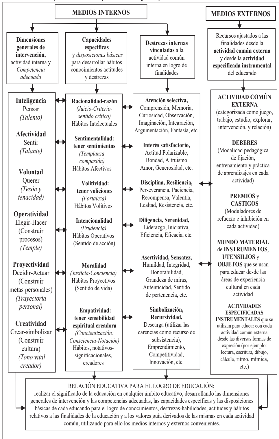
Cuadro 00: Medios internos y externos vinculados a dimensiones, actividades, competencias, capacidades y disposiciones del educando

Fuente: Touriñán, 2024, p. 454. Elaboración propia.