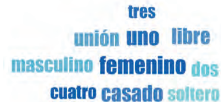
Figura 6. Palabras perfil sociodemográfico comunidad general

El perfil sociodemográfico de la comunidad general se presentan mayor presencia de participantes femeninas, pertenecientes en mayor al estado civil casado (a) y clasificados principalmente en estrato uno (1) (véase figura 6).