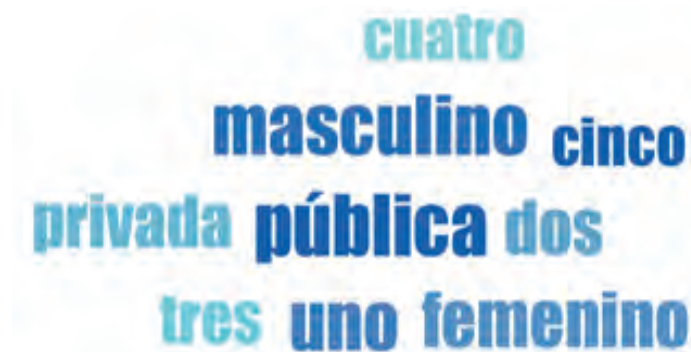
Figura 5. Palabras perfil sociodemográfico estudiantes

En el caso del perfil sociodemográfico de estudiantes se muestra mayor presencia de participantes masculinos, pertenecientes en mayor medida a una institución educativa pública y ubicados principalmente en estrato uno (1) (véase figura 5).