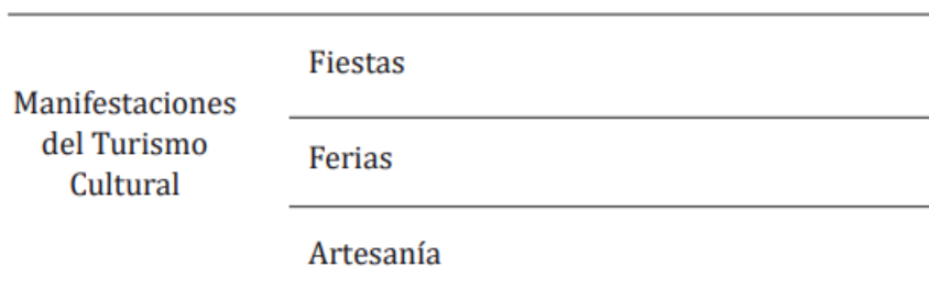
Figura 2. Manifestaciones del Turismo Cultural

Según los autores Paz, Sánchez, & Sánchez, (2018), hace referencia a las actividades que se dan dentro del turismo cultural que se identifican o se resaltan en la sociedad o entorno.