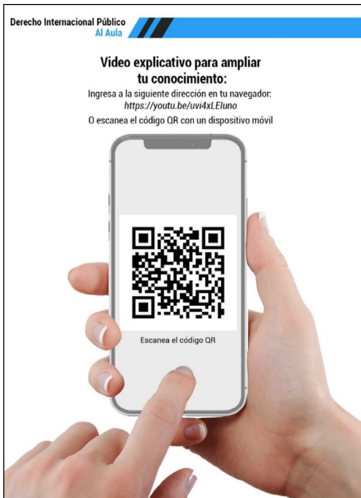
Figura 3 Código QR de origen y concepto del Derecho Internacional Público.