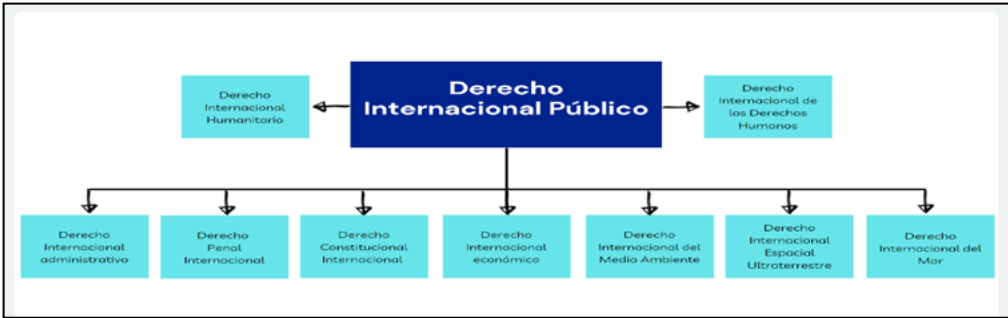
Figura 2 Divisiones del derecho internacional según su contenido.

Nace con el fin de conservar y proteger los recursos de la pesca y demás conexos con el mar, en el caso del nuevo derecho del mar incluye, las aguas de los archipiélagos, mar territorial y el tránsito por los estrechos