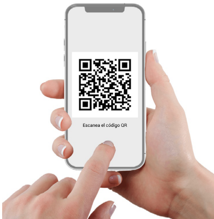
Figura 5 Código QR de Fuentes del Derecho Internacional.

O escanea el código QR con un dispositivo móvil