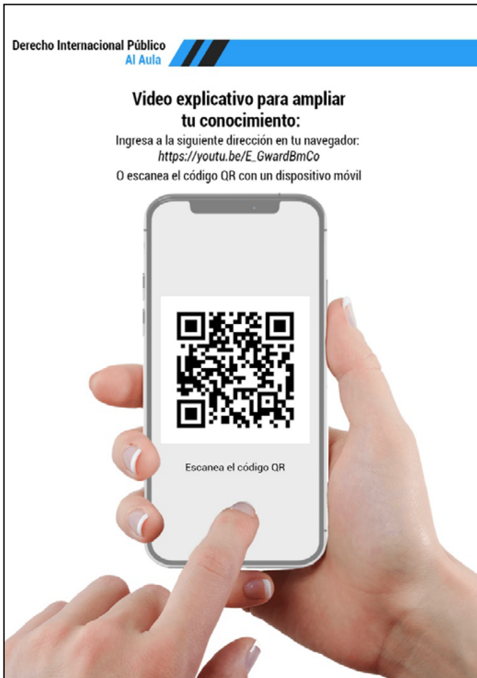
Figura 25 Código QR de Responsabilidades Internacionales.