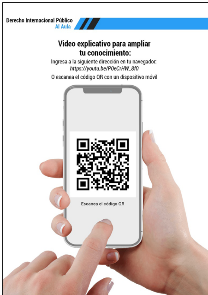
Figura 32 Código QR de Ámbitos de validez Internacional.