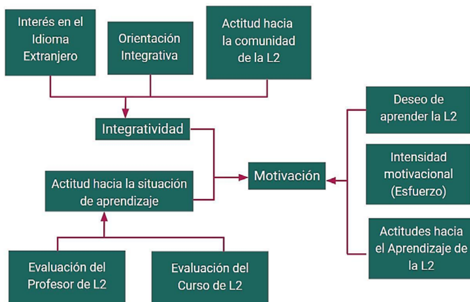
Figura 2 Representación del Modelo socioeducativo de Gardner. (1985)

Para ser más detallados, en factores integradores, los estudiantes deben aprender un idioma para un entendimiento superior y poder transmitir e interactuar con las personas que se comunican en el idioma. La motivación para comprender un idioma posterior lo ocasiona las emociones positivas hacia la misma comunidad que interactúa en ese idioma. Por tal motivo, Gardner (1985) expresa que, en el proceso de aprendizaje de un idioma se ven implícitos los factores socioafectivos. Tal como se muestra en la siguiente figura: