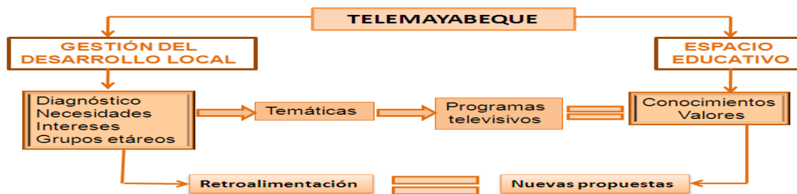
Figura 2. Ruta de trabajo desplegada por Telemayabeque para la concepción de su programación.

El tiempo de transmisión es de una hora y media diarias (5:00- 6:30 p.m) de lunes a viernes. Su programación es variada. Cuenta con programas infantiles, juveniles, científico-técnicos, musicales, deportivos, informativos, culturales, entre otros, en función de las necesidades de su entorno y colabora con las organizaciones e instituciones de la provincia. El Telecentro cuenta con una programación habitual y una programación de verano, con espacios que se mantienen durante todo el año y otros que recesan durante el verano para dar paso a nuevas propuestas. Además, existe una programación de cambio que está integrada por spots y otras promociones que se transmiten entre los programas. Actualmente, integran la parrilla de programación 14 programas: USB 3.0, Imagen, La casa del chef, Doble click, Punto de mira, En concierto, Luces, El laboratorio, Entre surco y guardarraya, En directo, De fiesta, ANSOC, Todo a su hora, Cóctel.