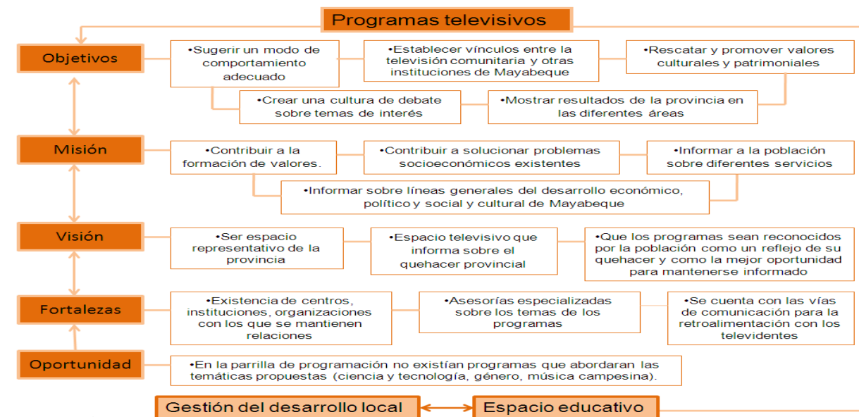
Figura 3. Elementos declarados en las fichas técnicas de los programas que se relacionan con la gestión del desarrollo local y su concepción como espacios educativos.

Como se mencionó anteriormente, el análisis de la propuesta de proyecto de cada programa y su ficha técnica permitió conocer las características fundamentales de cada espacio, su alcance, frecuencia, temática, objetivos, premisa, misión, visión, contenidos, debilidades, fortalezas, amenazas y oportunidades. A continuación, se refieren algunos elementos fundamentales que se derivaron del análisis y que demuestran la gestión del desarrollo local desde la programación televisiva: