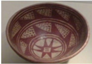
1. Vasija cultura Nariño

En la fotografía 4, se observa el trabajo final elaborado por un estudiante del Programa de Bacteriología y Laboratorio Clínico durante la electiva en primer período académico de 2019.