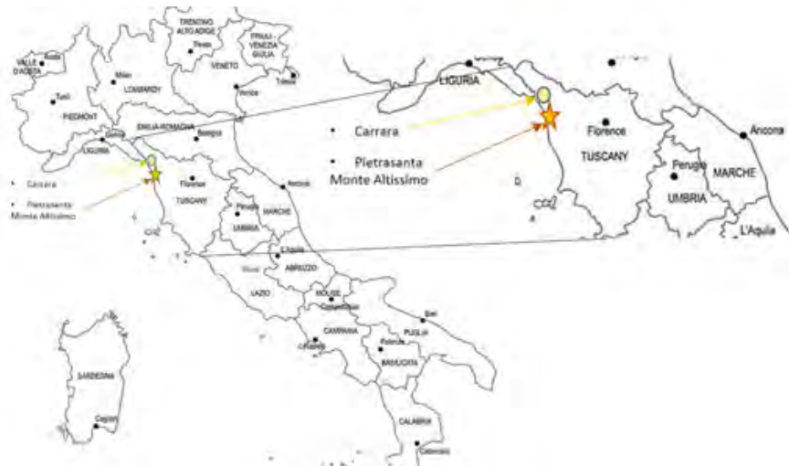
Imagen 2. Localización.