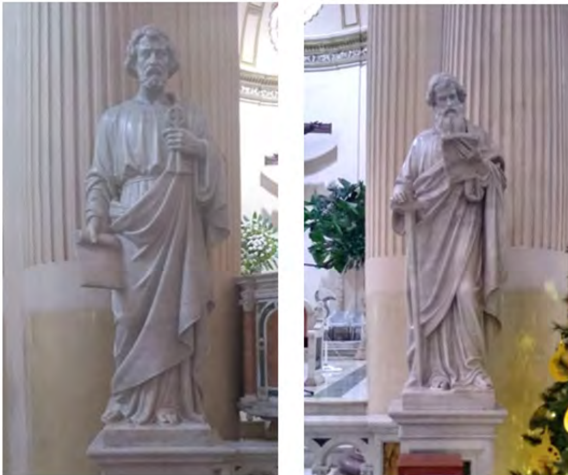
Imagen1. San Pedro y San Pablo.