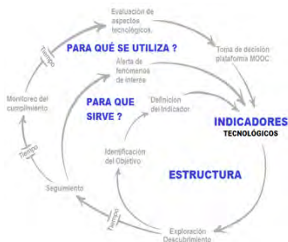
Figura 1: Funcionalidad del indicador de un MOOC, modificado y adaptado de la imagen tomada de https://cabreramc.files.wordpress.com/2015/04/marco_transformaciocc81n_ff.jpg

Para DNP(2009), un indicador es la presentación cuantitativa, verificable objetivamente, a partir de la cual se registra, procesa y presenta la información necesaria para medir el avance o retroceso en el logro de un determinado objetivo.