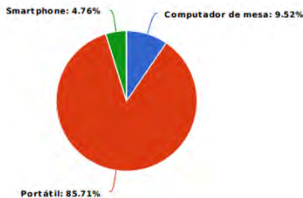
Grafica 3: Accesorios tecnológicos utilizados para el desarrollo de un curso.

Como se muestra en la gráfica 3 . El dispositivo más usado para realizar un MOOC con un 86% es el computador portátil, y en un 5% con Smartphone, ya que se manifiesta que no todas las plataformas cuentan con aplicativo móvil y es más complejo su uso.