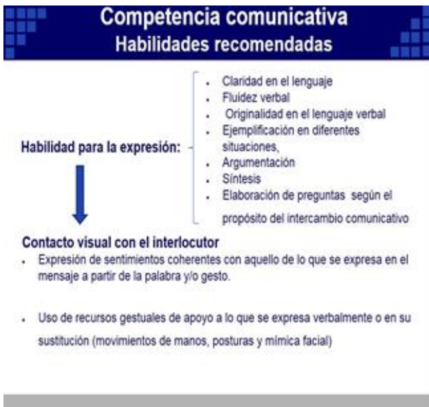
Figura #2. Habilidad para la expresión

Asimismo, se ofrece una síntesis de las habilidades recomendadas para el desarrollo de las competencias comunicativas, a partir de la lectura y análisis del artículo Las habilidades en la comunicación y la competencia comunicativa, de Delgado y Albellán (2007)