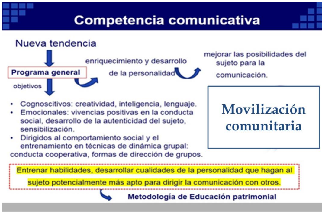
Figura #1. Competencia comunicativa y su relación con la educación patrimonial.

Asimismo, se ofrece una síntesis de las habilidades recomendadas para el desarrollo de las competencias comunicativas, a partir de la lectura y análisis del artículo Las habilidades en la comunicación y la competencia comunicativa, de Delgado y Albellán (2007)